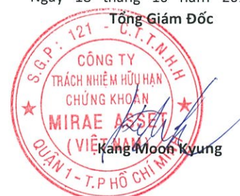
Kang Moon Kyung