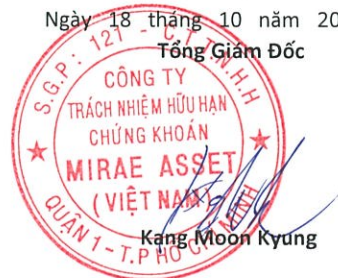
Kang Moon Kyung